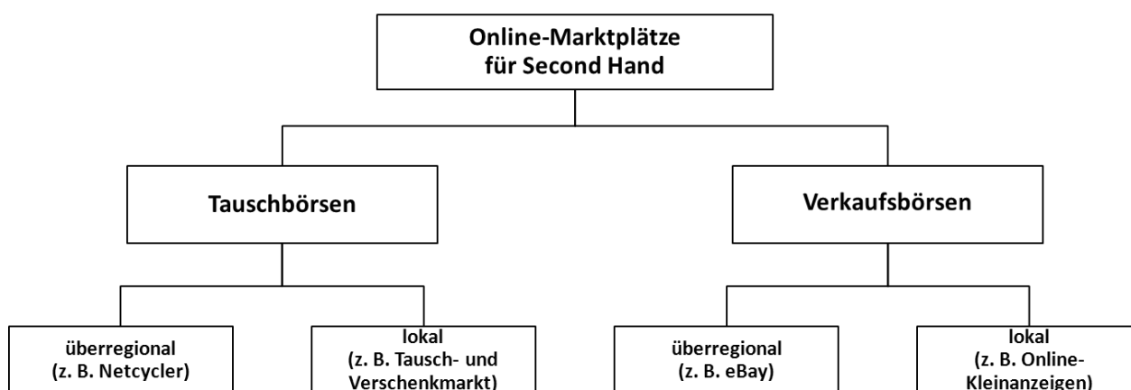
Abb. 3.2: Formen und Geschäftsmodelle für Online-Marktplätze für Gebrauchtwaren (eigene Darstellung)

Unter den Online-Marktplätzen für Gebrauchtwaren kann zwischen Tauschbörsen und Verkaufsbörsen unterschieden werden. Beide Typen ermöglichen die Weitergabe von gebrauchten Konsumgütern zwischen Privatpersonen (C2C). Die Leistung der jeweiligen Internetplattform liegt dabei in der Vermittlung und Organisation des Such-, Anbahnungs- und Abwicklungsprozesses zwischen den Tauschpartnern. Zudem kann bei beiden Typen zwischen überregionalen und lokalen Angeboten differenziert werden. Während ersteres Tauschgeschäfte unabhängig von der physischen Entfernung zwischen Anbieter und Nachfrager (Ortsungebundenheit) ermöglicht, ist der zweite Typ auf Transaktionen innerhalb lokaler Gruppen ausgerichtet (vgl. Abb. 3.2).